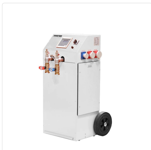
Master WB 20 – scaldacqua portatile

Consigliato per: emergenza in caso di guasto dell'impianto di riscaldamento, protezione antigelo, riscaldamento funzionale per il collaudo di nuovi impianti a caldaia, asciugatura del massetto.