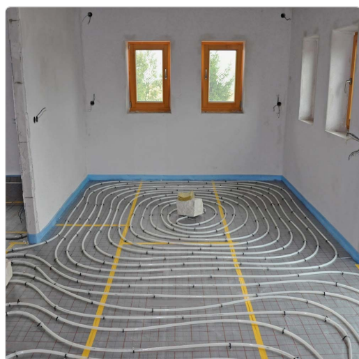
Scaldabagno WB 20 installato in